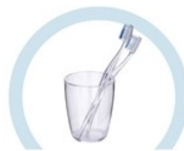
ТУАЛЕТНЫЕ ПРИНАДЛЕЖНОСТИ (ЗУБНЫЕ ЩЕТКИ, РАСЧЕСКИ И ПР.)