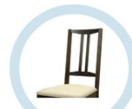
СПИНКИ СТУЛЬЕВ, НЕ ОБИТЫЕ ТКАНЬЮ И МЯГКИМ ПОРИСТЫМ МАТЕРИАЛОМ