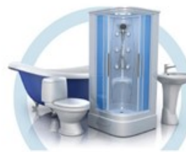
ТУАЛЕТ (УНИТАЗ, ВАННА, ДУШЕВАЯ КАБИНА, БИДЕ)