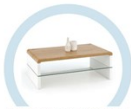
ЖУРНАЛЬНЫЕ СТОЛИКИ И ПРОЧИЕ ЖЕСТКИЕ ПОВЕРХНОСТИ